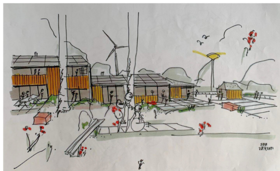
Impressie van de sfeer bij Het Bijzondere Huis. © Illustratie Fam. Bouchez

Daar zouden onder andere een speeltuin, een belevingstuin en/of een moestuin toe behoren. Het aantal parkeerplaatsen kan sterk worden ingekrompen; ze denken het met tien tot vijftien plekken te kunnen redden.