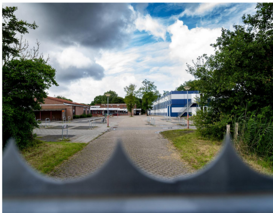
Het terrein is omhekt; een veilige leefomgeving voor de gehandicapten.

Ze begrijpen dat er ook woningbouw zou kunnen plaatsvinden en dat dat veel geld kan opleveren. „Maar als je met het terrein iets anders wilt en de fundering moet eruit, succes, dan ben je aan de beurt”, voorspelt Louis. Bovendien zit er een maatschappelijke bestemming op het perceel en die kan er niet zomaar af; daar heeft de gemeenteraad een stem in. En, zegt Louis: „Wat wij willen is natuurlijk ook woningbouw.” Er komen immers 24 gehandicapten te wonen, en het beheerderschtpaar.