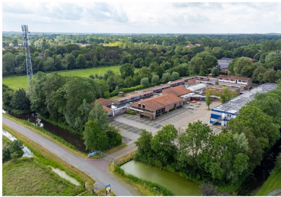
De opstellen zoals ze er nu bij staan. Rechts de blauw-witte tijdelijke behuizing van de BSG, links de nieuwe UMTS-mast.

„Het is een groot terrein, en dat is ook belangrijk”, stelt Louis. „Veel gehandicapten zitten in een rolstoel, dan heb je veel ruimte nodig. Er staat een hek omheen, daardoor kunnen we er een veilige situatie en een mooie leefwereld creëren. De omgeving is groen, je kunt zo naar de weilanden kijken met schapen erop.”